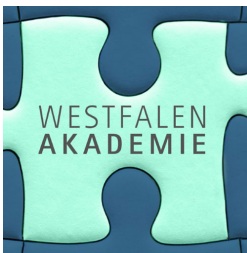
© Stiftung Westfalen-Initiative für Eigenverantwortung und Gemeinwohl